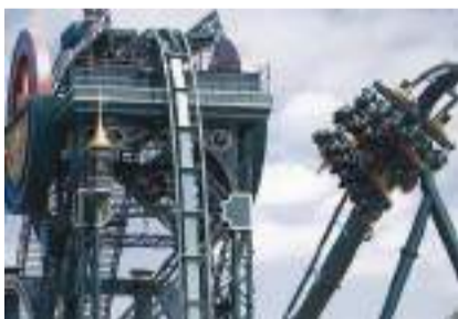
▲ 图片来源: Efteling

男爵1898带领游客穿梭至荷兰采矿工业蓬勃发展的19世纪末，游客们扮演起矿工的角色，体验从37.5米(约123英尺)高处自由落体，以大约每小时90公里的速度进入矿井，感受荷兰采矿的历史发展。