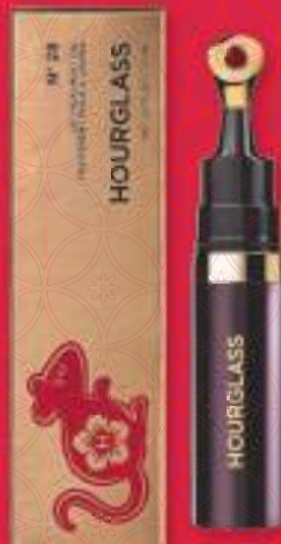
Hourglass Limited Edition Lip Treatment Oil 'at night' €53,-

为庆祝农历新年，Hourglass推出N°28唇部护理油专属型号：At Night。