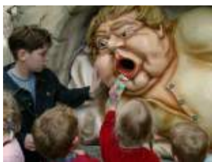
▲ 图片来源: Omroep Brabant

乐园以这种有趣的形式既可以增强游客的主题感和体验感，同时也可以培养孩子从小就爱环保的意识。