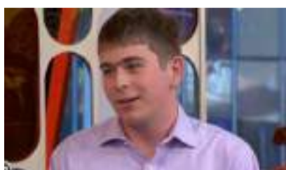
▲ 图片来源:New Zealand Global

而实习才第三天,库基尔就发现异常,他注意到两颗恒星的轨道上有东西挡住了光。之后,他的老板花了几天时间核实他的观测结果,并最终证实是发现一个全新行星,而且是TESS发现的首个环联星运转行星(circumbinary planet),即是同时环绕两颗恒星运转的