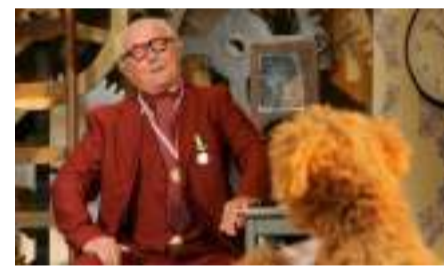
▲ 图片来源: NRC