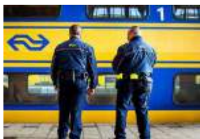
▲ 助“制服”,直到警察将他带走。

根据统计,去年荷兰共发生了800多起被记录在册的NS工作人员遭受暴力的事件,包括285起威胁事件和222次人身暴力事件。2017年,共发生了642起。