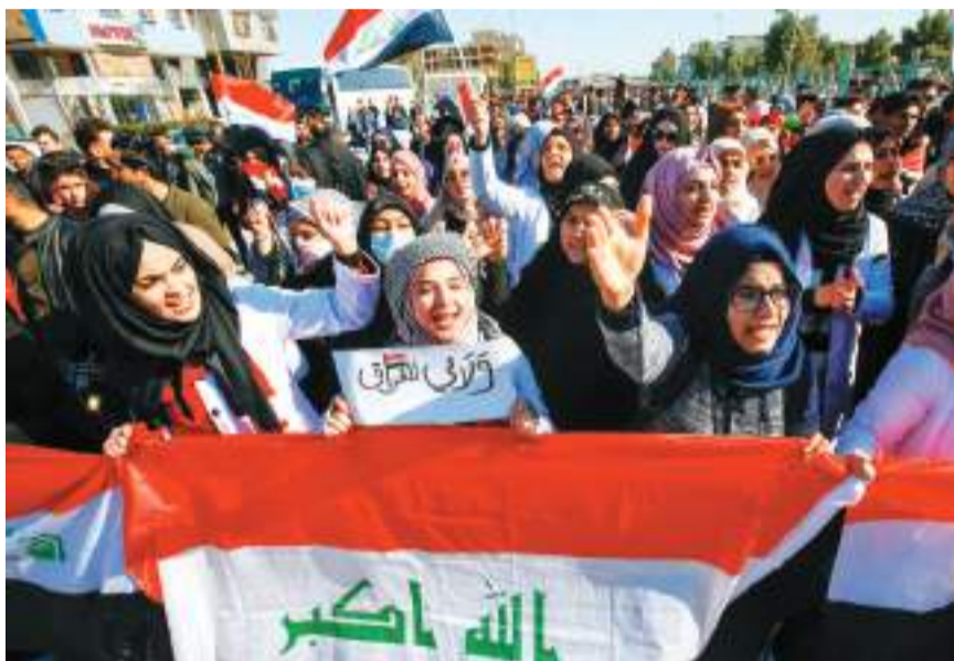
▲12日，在伊拉克纳杰夫，大学生们在持续的反政府抗议活动中高喊口号。

载有176名乘客的乌克兰客机坠毁3天后，伊朗政府承认是客机是被导弹误射。当地时间11日下午，人们在德黑兰街头为遇难者举行烛光守夜。有数千名参与者随后转向反政府示威抗议。示威者在街头高喊着：“为哈梅内伊感到羞耻，离开这个国家。” 眼见美伊矛盾转移，特朗普总统和国务卿蓬佩奥表现活跃，直接喊话伊朗政府、声援示威者。特朗普更是连发两条推文（Twitter）称与“伊朗抗议者同在”，还特地附上了波斯语译文。