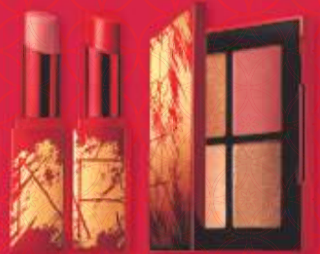
NARS CNY limited edition collection From €15,- and up

如果您还在考虑制定新年决议，请想想这个全新的开始：农历新年以阴阳历为标志，因此您有第二次机会为下一年的成功做好准备。仅在女王店，我们拥有最畅销的夜间修复精华。