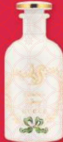
Gucci Beauty Winter's Spring, Mimosa, 100ml, eau de parfum €295,-

有趣！这个系列叫做“月球幻影”，它包括了一些M.A.C.的畅销产品，并且采用了全新包装。