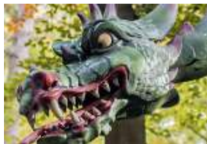
▲ 图片来源: Loopings

乐园内还有几个室内小剧场也十分精彩。这些剧场的规模都在50平米以内，没有恢弘的大场面，没有演员演出，没有观众席，所有游客都站着看完不足10分钟的演出。即使如此，小剧场依旧是游客的必到之处。