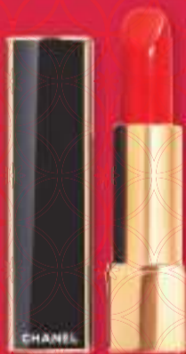
Charlotte Tilbury Charlotte's Magic Cream Lunar New Year 50ml €90,-

为庆祝中国春节，炫亮魅力唇膏丝绒系列的色标志性58号口红“ROUGE ALLURE”配上限量版红色烤漆的外壳。散发令人难以置信的光芒，令人舒适的，天鹅绒般柔软的口感。像第二层肌肤。