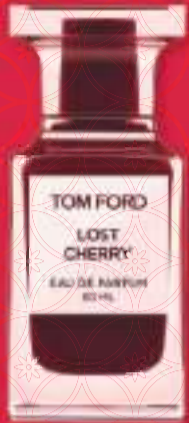
Tom Ford Lost Cherry €281,50

“落樱甜晴香是一种新方香味，装饰以花朵和甜樱桃气味：强烈而大胆。去年的Fucking Fabulous获得灵感，杏仁，零陵香豆和木料的混合，在这里以新的样式呈现。这款最新的香水拥有特别的糖果般的主题，细腻，甜美和令人满足。好吧，确实很难抵制土耳其玫瑰和烤香豆腐气味的混合，不是吗？”