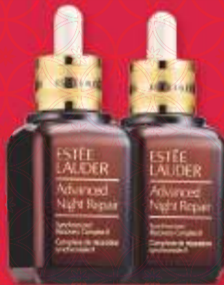
Estee Lauder Advanced Night Repair Duo €278,-