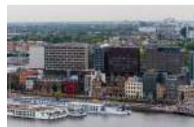
▲ 图片来源: IAmsterdam

2019年1-6月，中国对荷兰投资流量8.5亿美元；截至2019年6月，中国对荷兰投资存量为205.8亿美元，荷兰是