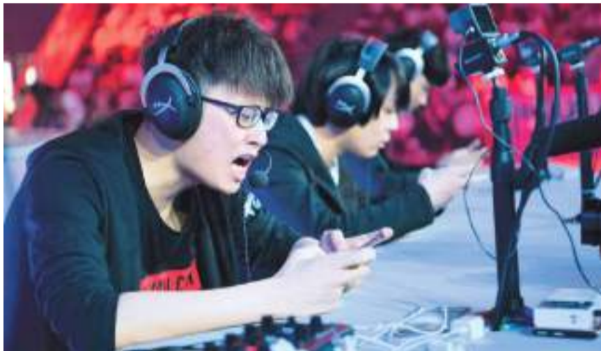
▲ 2019年8月10日，长江三峡电子竞技大赛总决赛在重庆忠县三峡港湾电竞馆举行。

如果电竞最终变成新一轮招商引资的噱头，而缺少完善的产业基础和可落地的产业规划，那依靠电竞来拉动地方经济转型，究竟是不是个伪命题？目前仍存争议。