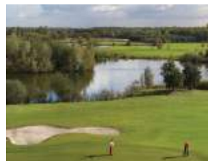
▲ 图片来源: Efteling

艾夫特琳高尔夫公园也是年轻的高尔夫球手进行练习的绝佳场地，它被荷兰高尔夫协会授予了“致力于青少年”和“致力于家庭”的认证。公园里的Grand Café Fore! Seasons 内有三处会议场地，将高尔夫球场的风光尽收眼底。