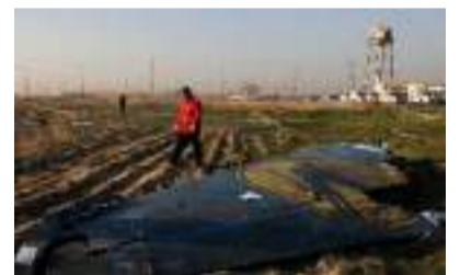
▲ 图片来源:New York Times

737-800客机8日早晨从德黑兰霍梅尼国际机场起飞前往乌首都基辅，但起飞后不久坠毁，机上167名乘客和9名机组人员无一生还。伊朗此前曾否认失事客机遭导弹击落的报道，表示初步调查显示客机因“技术问题”坠毁。