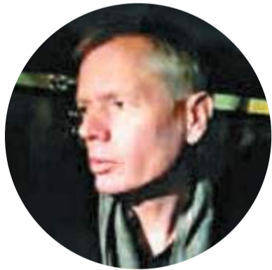
▲英驻伊朗大使马卡伊雷。

此外，据伊朗官方通讯社报道，由于失事客机上还有加拿大籍乘客，鲁哈尼还与加拿大总理特鲁多通电话，承诺对事件进一步调查。双方同意两国合作，彻查事件细节。