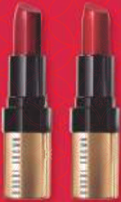
Bobbi Brown New Year 2020 Holiday Collection From €37,50 and up