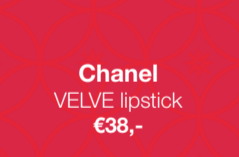
Chanel VELVE lipstick €38,-

“畅销品。大胆的未来。为庆祝新年，NARS推出了以美丽和幸运为灵感的限量版系列。再续畅销产品的辉煌。豪华的红色镀金包装。大胆与创新更能带来幸运。”销的夜间修复精华。