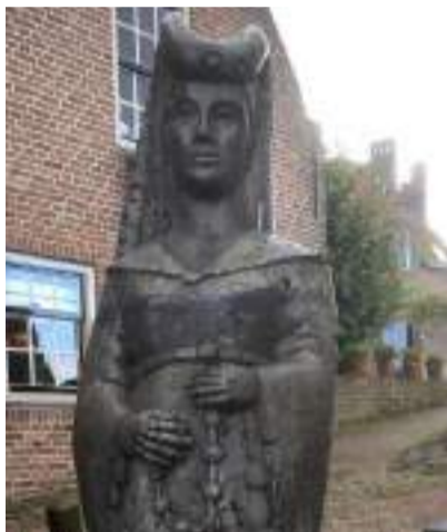
▲ 埃诺、荷兰、泽兰女伯爵雅各巴