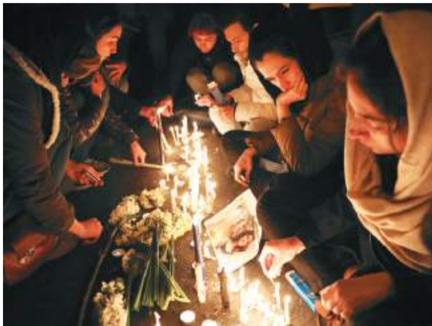
▲11日，人们聚集在阿德里卡比尔大学门口举行烛光守夜活动，缅怀飞机失事遇难者。据了解，此次坠机的部分遇难者是该校学生。