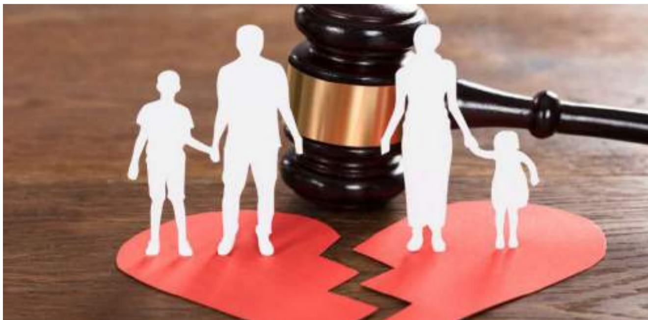
▲ 图片来源: lamexpat