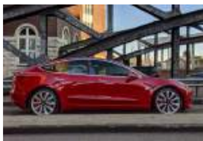
▲ 图片来源: Autovisie

去年第三季度，特斯拉在荷兰交付了7000多辆新车，第四季度的交付量可能超过1.5万辆。该公司第四季度