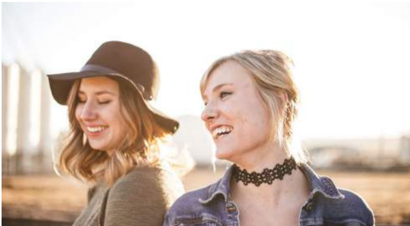
▲ 图片来源: Unsplash