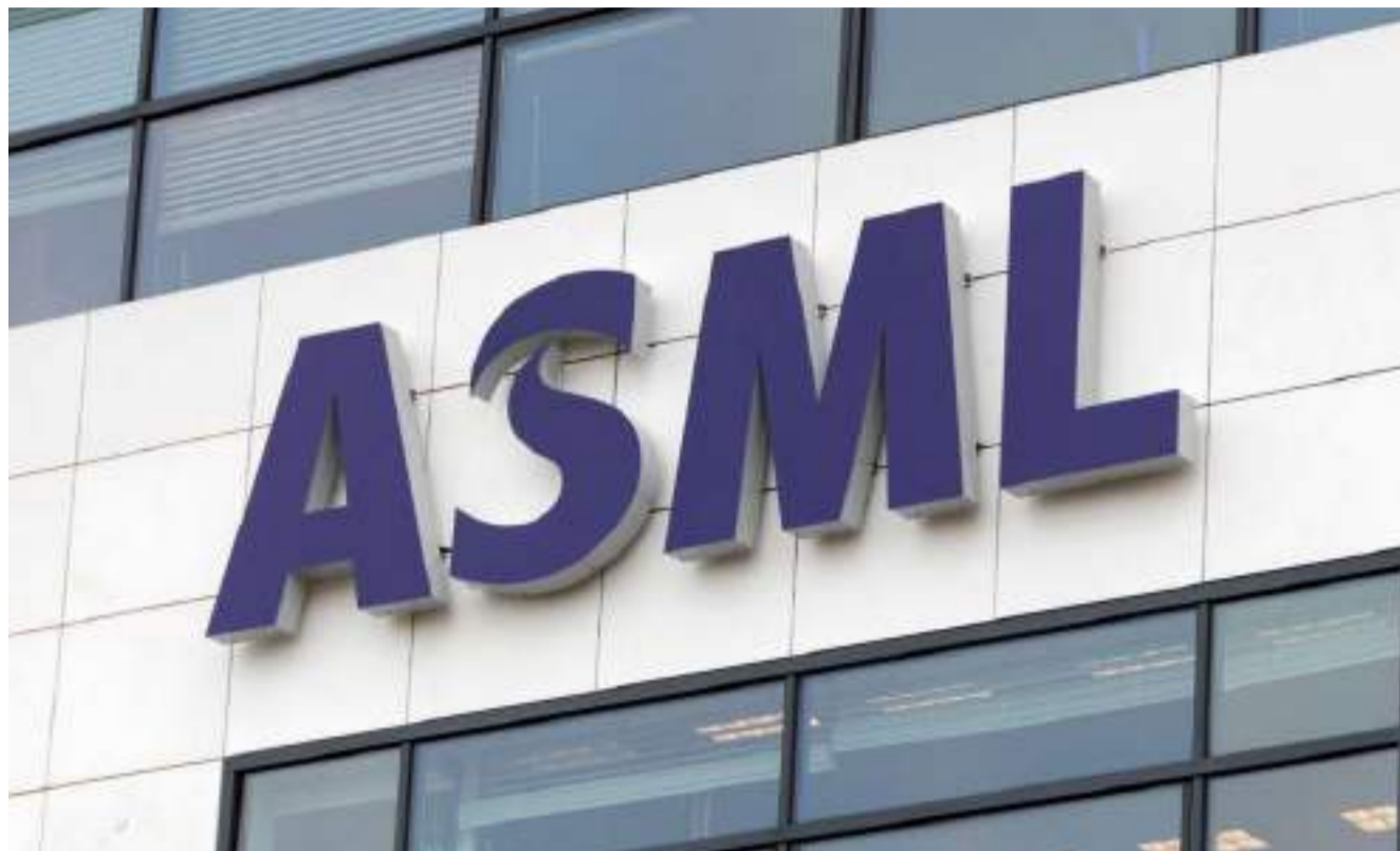
▲ 图片来源: Techzine

宫后不久，荷兰政府决定不更新ASML的出口许可证，价值1.5亿美元的设备仍然没有发货。